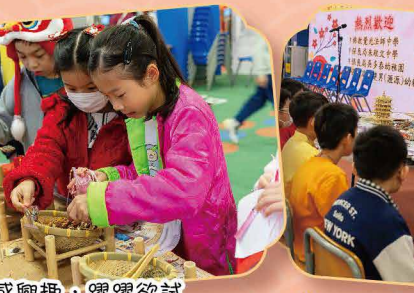
中國傳統工藝和運動，大家都很感興趣，躍躍欲試