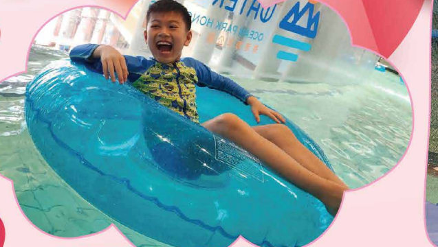
參加親子水上樂園活動，享受家庭樂。

本年「騰訊基金會」再次於香港舉行「99公益日」的慈善項目——「與小紅花一起做好事」，延續保良局與騰訊公益慈善基金會「與小紅花一起做好事」的慈善活動，舉行了富趣味性的學習活動及親子體驗活動，以發掘學生的潛能和促進親子關係。