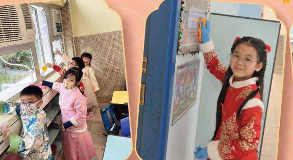
我們都是愛勞動、愛校園的好孩子，歡樂之頃，不忘替課堂大掃除