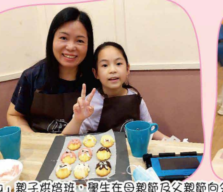
「Cooking Mama/Papa」親子烘焙班，學生在自製節及父親節向父母表達謝意。