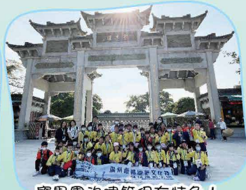
寶墨園的建築很有特色！