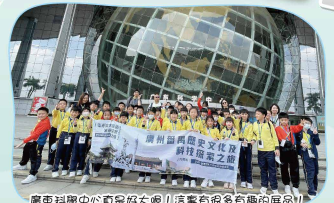
廣東科學中心真是好大呢！這裏有很多有趣的展品！

學校於1月19日安排40名四年級學生乘搭高鐵前往廣州寶墨園及廣東科學中心。當天行程豐富、充實，學生在不一樣的環境中學習。在旅程中，學生認識廣州番禺的歷史文化，了解嶺南的古建築風格和特色，同時認識科技的發展及應用，以及增加對大灣區城市發展的認識。