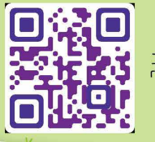
歡迎掃描二維碼觀看「森林課程」活動相片