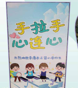
成都市武侯區教科院附屬小學 熱烈歡迎在小的同學到訪