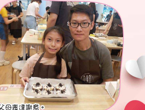
「Cooking Mama/Papa」親子烘焙班，學生在自製節及父親節向父母表達謝意。