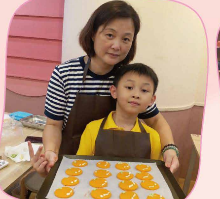
「Cooking Mama/Papa」親子烘焙班，學生在自製節及父親節向父母表達謝意。