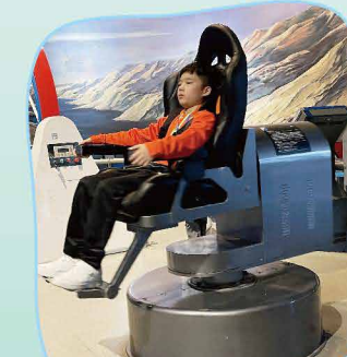
不久的將來，我會成為太空人！