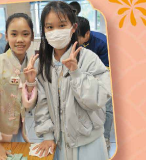
我們都是愛勞動、愛校園的好孩子，歡樂之頃，不忘替課堂大掃除