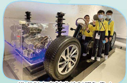
我們對汽車製造特別感興趣！