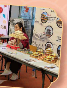
中國傳統工藝和運動，大家都很感興趣，躍躍欲試