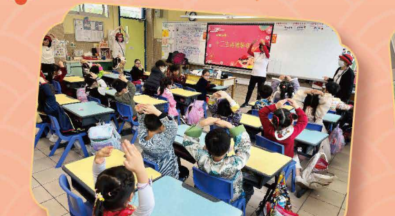
總是一群充滿朝氣、活力的長者(小藍帽)贈講有關龍的繪本，大家都樂在其中