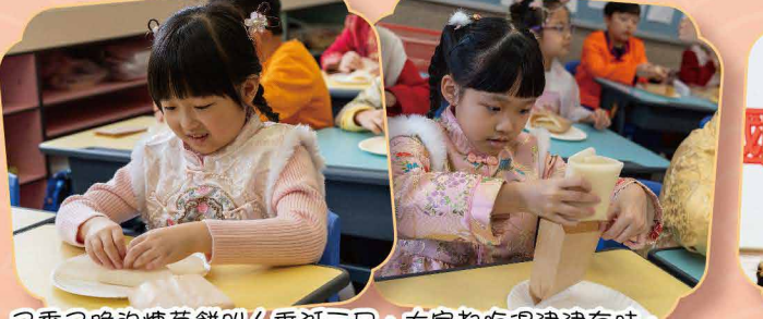
又香又脆的糖蔥餅叫作垂涎三尺，大家都吃得津津有味，甜在心頭