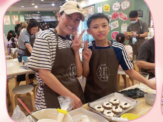
「Cooking Mama/Papa」親子烘焙班，學生在自製節及父親節向父母表達謝意。