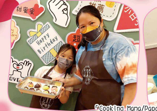
「Cooking Mama/Papa」親子烘焙班，學生在自製節及父親節向父母表達謝意。