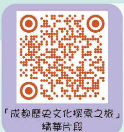
「成都歷史文化探索之旅」精華片段