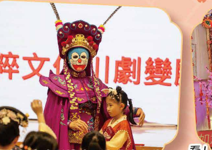
國粹表演精彩絕倫，全場的師生都贊為觀止、拍案叫絕！