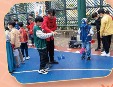
中國傳統工藝和運動，大家都很感興趣，躍躍欲試