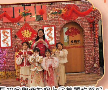
看！校長和同學們都穿上了美麗的華服，向大家熱情地拜個早年，祝願大家身體健康！學業猛進！