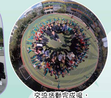
交流活動完成後，師生一同大合照留念