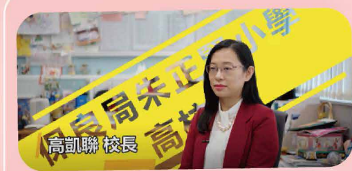
【親子小錦囊】EP01相處時光 | PRIDE | 有質素的陪伴