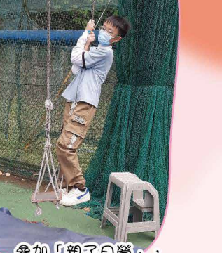
參加「親子日營」，發揮潛能，樂在其中