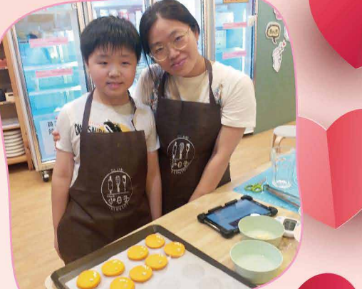
「Cooking Mama/Papa」親子烘焙班，學生在自製節及父親節向父母表達謝意。