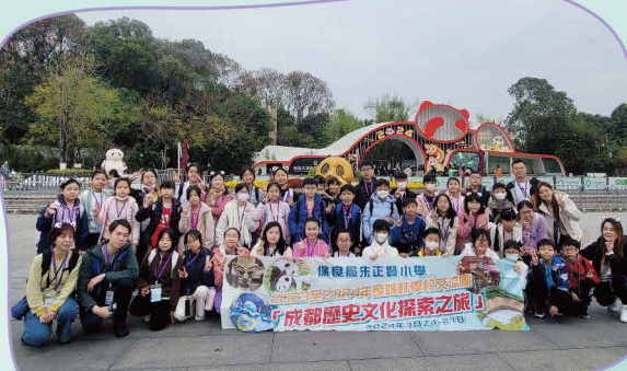
參觀大熊貓繁育研究基地