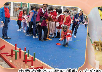
中國傳統工藝和運動，大家都很感興趣，躍躍欲試