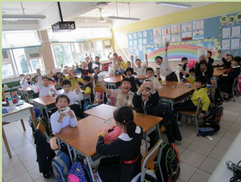
能收到自己喜歡的菜苗，學生們都很開心，也很珍惜！