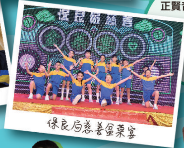
保良局慈善盃樂宴