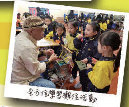
全方位學習攤位活動