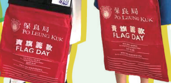
保良局 PO LEUNG KUK 賣旗籌款 FLAG DAY