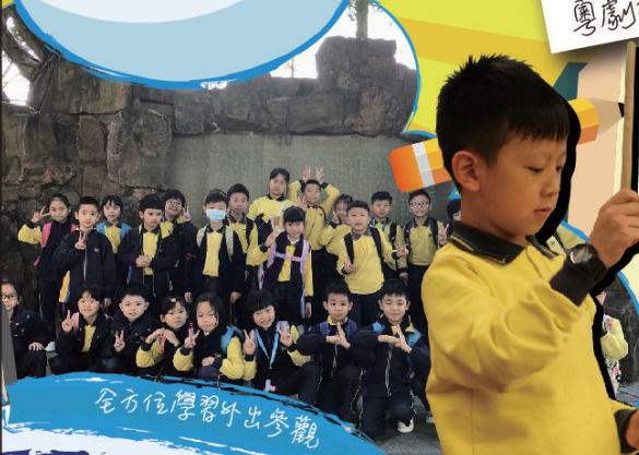
全方位學習外出參觀