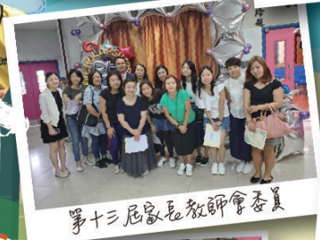
第十三屆家長教師會委員