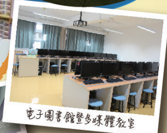
電子圖書館暨多媒體教室