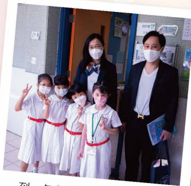
到一年級課室跟小朋友聊天