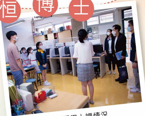
了解同學上課情況