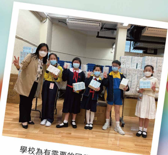
學校為有需要的同學派發快測包