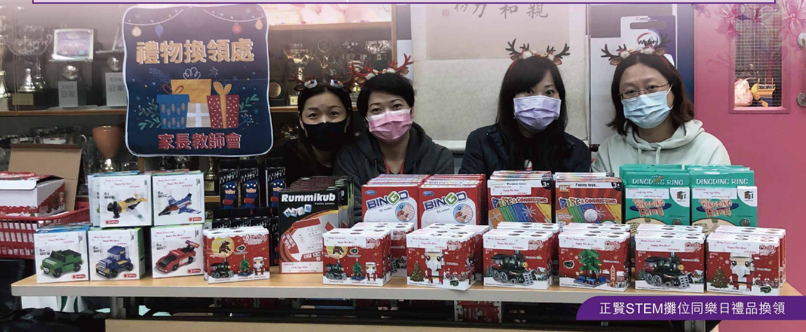
正賢STEM攤位同樂日禮品換領